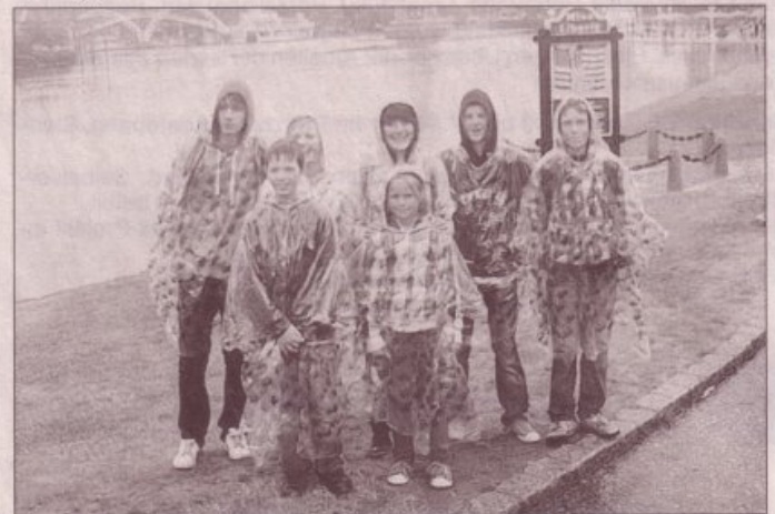
Trotz Regen im Freizeitpark gute Laune, die Gruppe aus Bad Oidesloe

Ein Programmpunkt während des Zeltlagers war die Fahrt in den Freizeitpark nach Soltau. Den ganzen Vormittag Regen, Regen, Regen. Das tat der Stimmung aber keinen Abbruch. Ausgelassen wurden alle Angebote ausgenutzt und vor dem Wasser musste man keine Angst haben, man war ja schon nass. Als am Nachmittag dann auch noch die Sonne scheu auf das Gelände schaute, war alles prima, so die Jugendlichen nachdem sie wieder im Zeltlager angekommen waren. Ein unvergessener Tag.