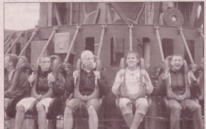
.....und die polnischen Gäste